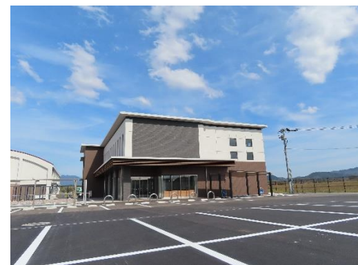
幸袋交流センター

生涯学習に係る学びの場であるとともに、住民の活発な活動による地域課題の解決や、地域コミュニティの増進のための拠点である各交流センターの整備を行っています。