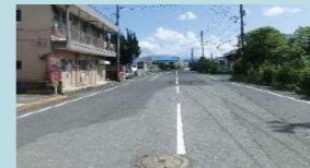
市道卸売市場2号線現況

大規模集客施設の周辺道路整備では歩行者が安全・安心に移動できると共に、人の移動による賑わい創出に繋がる歩道の新設を行います。