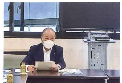
豊田市役所での意見交換会

デジタル人材の育成、AIを活用した相談窓口の設置等説明を受け、貴重な体験をしました。今後役にたいて考えています。