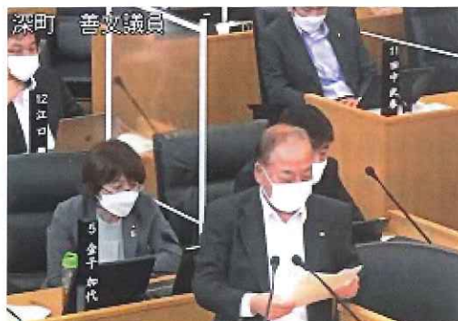
令和4年6月定例市議会より

最後になりますが、コロナウィルス感染症も第7波を過ぎ、収束に向かいつつあります。いよいよウィズコロナ(コロナと共存)に向けて政府も県も動き始めました。コロナ禍の中で私たちの生活の有り様が大きく変わりましたが、これまでの日常を一日も早く取り戻せるように願うばかりです。これから冬に向かい、新型コロナウイルス感染症やインフルエンザが流行しやすい時期になります。お身体ご自愛ください。