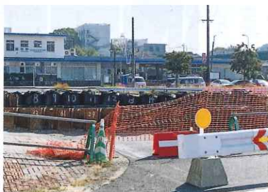
再開発が進むJR飯塚駅前

また飯塚市卸売市場の庄内工場団地移転に伴い、JR飯塚駅及び菰田周辺地域の再開発がはじまりました。