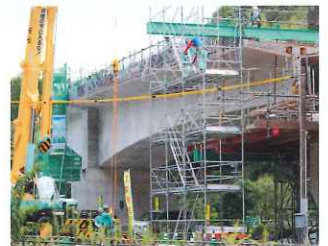
八木山バイパス4車線化 篠栗側(山手)橋梁工事

(深町) 飯塚市の発展、筑豊地域の全体の発展には八木山バイパスの4車線化、県道478号線の全線完成、穂波西インターフル規格化が交通結末点として非常に重要です。穂波西インターのフル規格化は、飯塚市が進めている移住・定住の促進を加速し、飯塚市全体の発展に繋がるものと確信しています。このことから穂波西インターのフル規格化がぜひ実現するよう、これまで以上に一層の要望を国へ粘り強く行っていただくよう申し上げます。