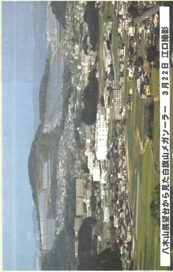
八木山展望台から見た白旗山メガソーラー 3月22日

【議員定数について参考人招致】市議会議会運営委員会へ参考人としてきて頂いた法政大学の土山教授、大正大学の江藤教授のお話が市議会のウェブで見ることができます。【飯塚市議会 令和4年2月24日】【飯塚市議会 令和4年2月28日】で検索すると出てきますので、ぜひご覧ください。議会とは何かを考える上で参考になること間違いなしです。