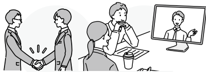
商談会や展示会(オンライン含む)