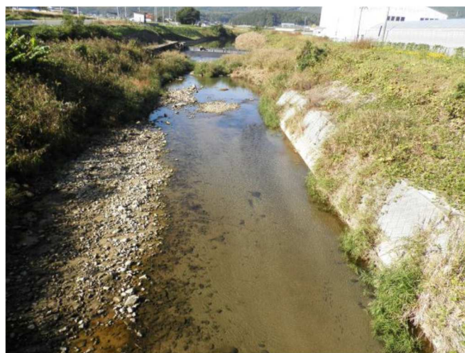
久保白橋地点の様子