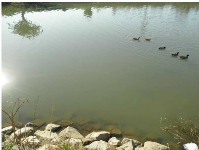
太郎丸樋管の様子