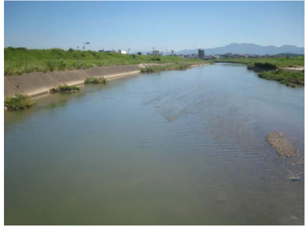
若菜橋地点の様子