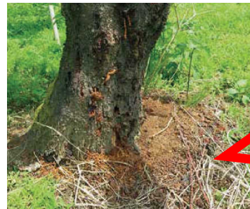
クビアカツヤカミキリのフラス