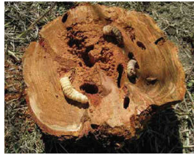
クビアカツヤカミキリの幼虫