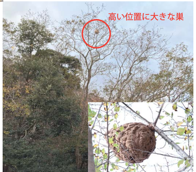
高い位置に大きな巣

環境省 自然環境局 野生生物課 外来生物対策室 〒100-8975 東京都千代田区霞が関 1-2-2 TEL:03-5521-8344 FAX:03-3504-2175