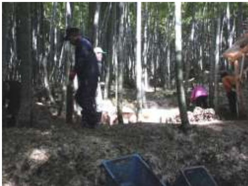
竹林整備活動団体の活動の様子

しかし、里地、里山などの二次的な自然環境においては、その管理は十分ではなく、その価値を再評価し、適正な管理を行うために、より一層、遠賀川流域全体の全ての人々の努力が必要です。そのために、行政が適切な森林管理、休耕田や耕作放棄地対策、自然とのふれあいに関する活動等の環境活動団体への支援を図る必要があります。