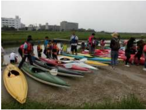
遠賀川ボヤージュの様子