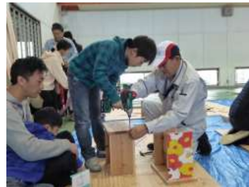
同時開催「～木をかこう～ DIY 木でつくろう！木をかこう！」の様子