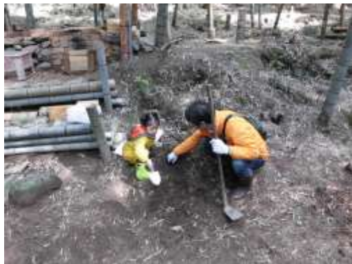
たけのこ掘り体験会の様子