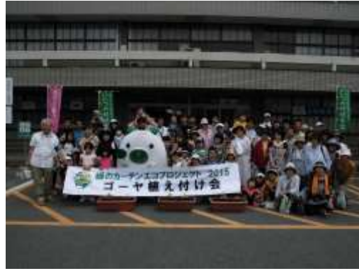
ゴーヤ植え付け会の様子