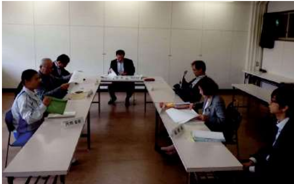
検討委員会の会議の様子

市内の温熱利用施設からの CO 2 排出量の削減に向けた再生可能エネルギー設備導入の効果の検討を行い、その可能性を調査するため、温熱を利用している公共施設への太陽熱を利用した温水供給の可能性について調査・検討を行いました。