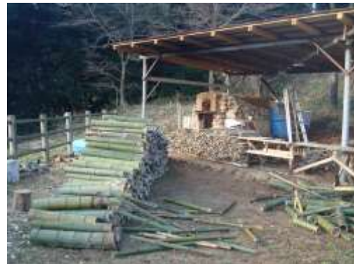
伐採した竹を竹炭に活用