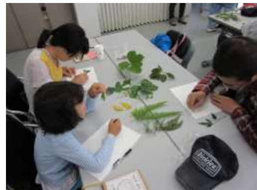
自然あそびワークショップの様子