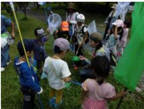
いきものさがしの様子

概要：飯塚の森を歩き、木やきのこ、むしに鳥など、自然に詳しい「はかせ」達と、いきものをさがして観察しました。また、森でみつけた自然の草木を使って自然あそびワークショップを行いました。延べ180名の参加がありました。