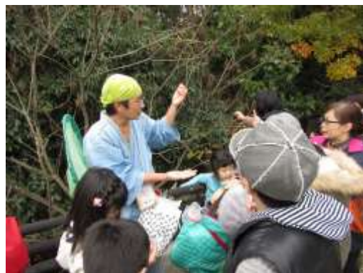
自然体験プログラム「飯塚の自然を思いっきり楽しもう!!」いいねんの様子