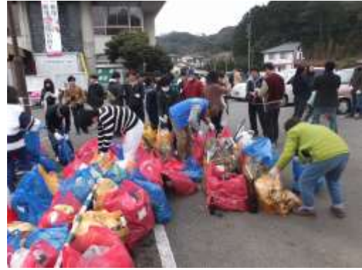
二瀬地区まちづくり協議会のクリーンキャンペーンの様子