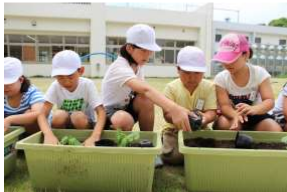
颯田小中一貫校でのゴーヤ植え付けの様子