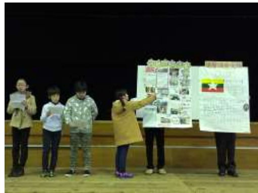
活動事例発表の様子