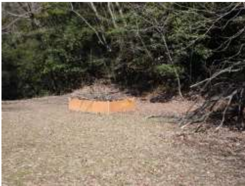
かぶとむしの産卵・育成場所

概要：笠城ダム公園の二次林（コナラ林）をかぶとむしの成長しやすい環境とするための堆肥づくりや、自然観察のための樹木名プレートづくり等を行い、環境学習を実施しながら、自然を観察・体験学習できるフィールドに整備しました。自然観察会&樹木名プレートづくりに 17 名の参加がありました。