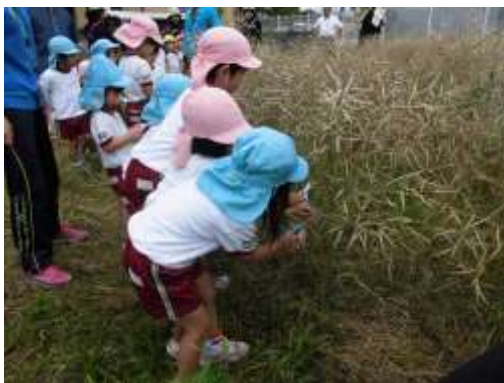
菜種の収穫の様子

概要：NPO 法人こすみんず、潤野保育園、横田保育園と協働し、収穫作業や搾油作業等を実施しました。また、サイエンスモールでは、来場者の方々に搾油作業を体験いただき、菜の花プロジェクトでの取り組みを広報しました。