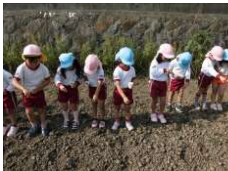
潤野保育園での種まきの様子

3) COD パックテスト : 水中の有機物を薬品で化学反応させるときに消費される酸素の量を表したもの。 一般に、COD の値が大きいほど、水の汚れ(有機物)の量が多いと言える。