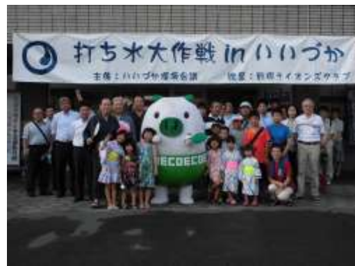
打ち水大作戦の様子