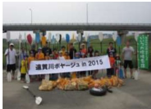
川の中・河川敷清掃の様子