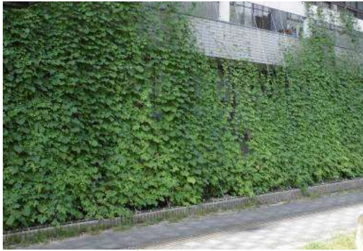
市役所南面を覆った緑のカーテン

しかしながら簡易計算ではありますが、平成 20 年度～平成 25 年度の温室効果ガス排出量は増加しています。平成 26 年度以降の推移を見守るとともに、省エネ行動の普及・啓発や、行政の率先した取組を、より一層強化する必要があります。