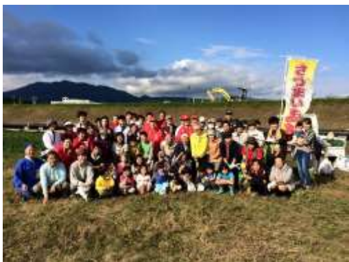
さつまいもづくりの様子