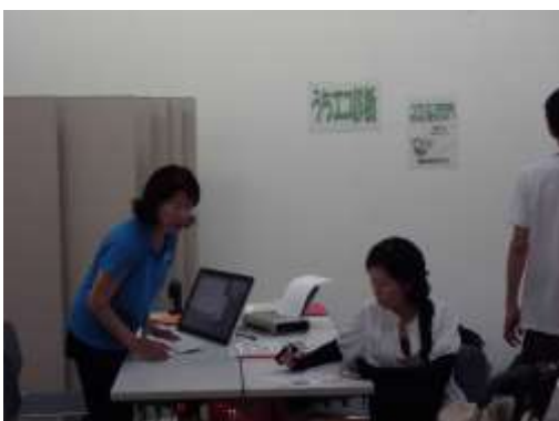
うちエコ診断の様子