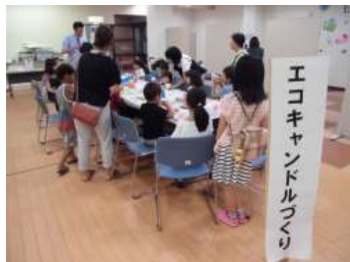
エコキャンドルづくりの様子