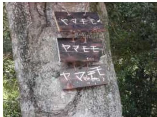
木に据え付けた樹木名プレート