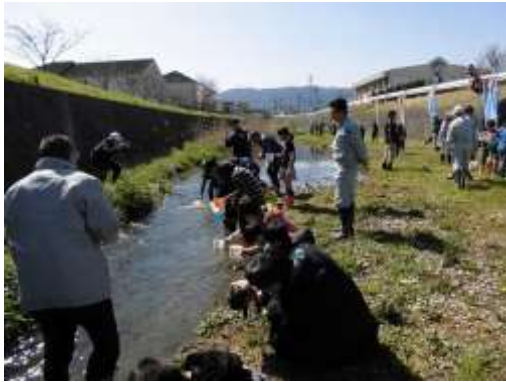
伊岐須小学校での鮭の稚魚放流会の様子