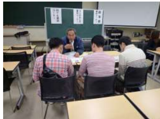
大学での出張窓口の様子