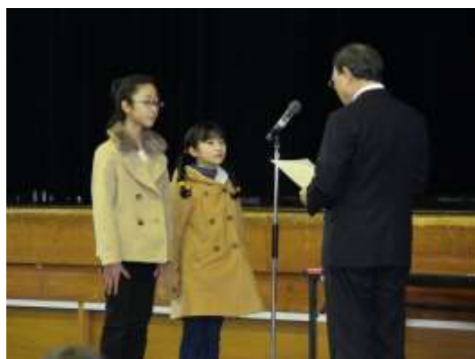
「エコスタいづか」の様子