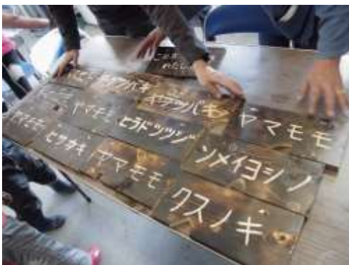
作成した樹木名プレート