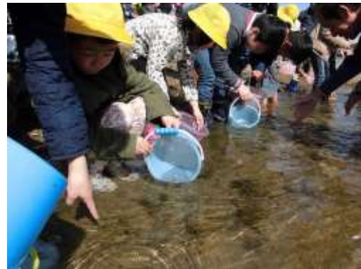
楽市小学校での鮭の稚魚放流会の様子