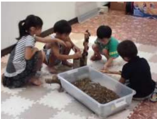
カブトムシふれあいコーナーの様子

概要：商店街にある「街なか交流・健康ひろば」を「街なかオアシス」の呼称で避暑スポットとして開放し、ミニ講座や催しを開催しました。また、商店街の数店舗を街なかオアシス協力店として登録し、商店街への来訪を呼びかけ、多くの方々がクールシェアを実践されました。開催期間中は、約 300 名の来場参加者がありました。