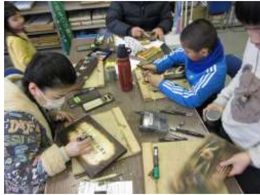
樹木名プレートづくりの様子