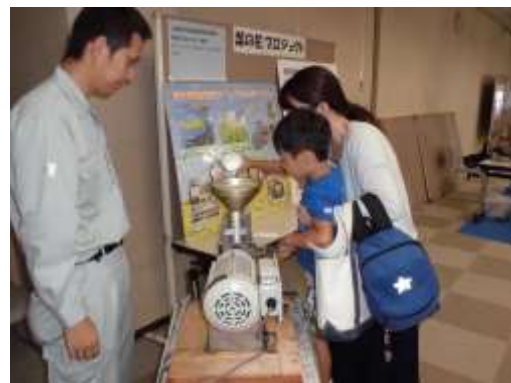
サイエンスモールでの様子