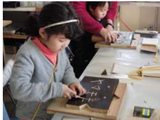
樹木名プレートづくりの様子