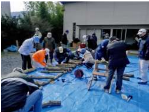
しいたけホダ木づくりの様子