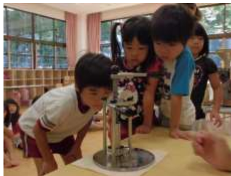
蓮台寺小学校での菜種しぼりの様子