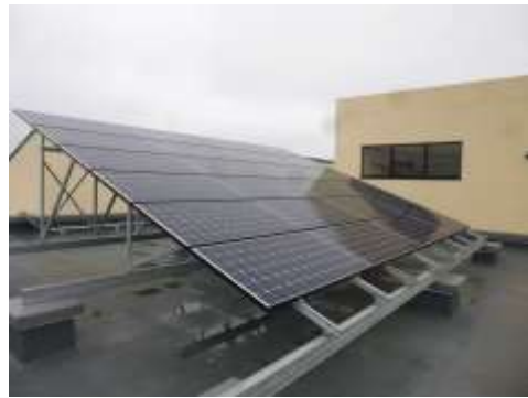
菰田保育所に設置された太陽光発電設備