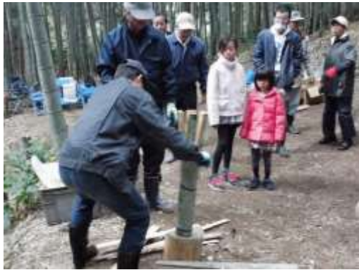
竹炭づくりの様子