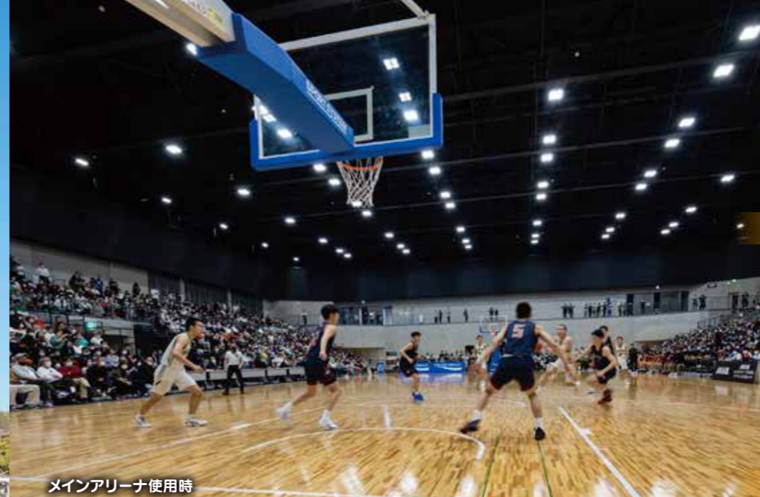
メインアリーナ使用時