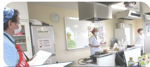
まず、最初に作り方の説明をします。