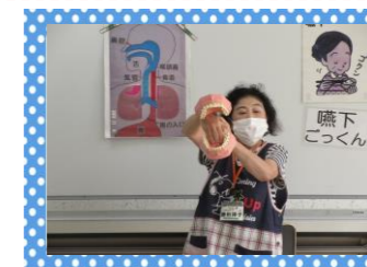
先月の「パタカラ体操」の様子です