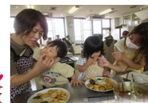
先月の「お月見だん作り」の様子です