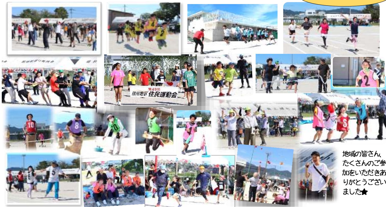
地域の皆さん たくさんのご参加をいただき ありがとうございました★