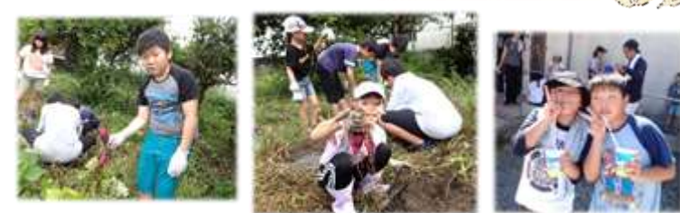
収穫と草刈りと土づくりを2日に分けてしました。頑張った後はかき氷でクールダウン!

手入れ作業・土づくりと収穫 9月2・3日(土・日) 秋野菜の種・苗植え 9月17日(日)