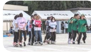
飯塚東まちづくり協議会 住民体育祭実行委員会