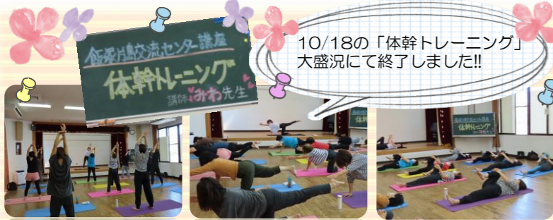
10/18の「体幹トレーニング」大盛況にて終了しました!!