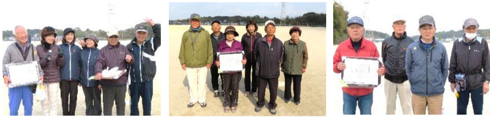
参加者の皆さん、寒い中お疲れさまでした！