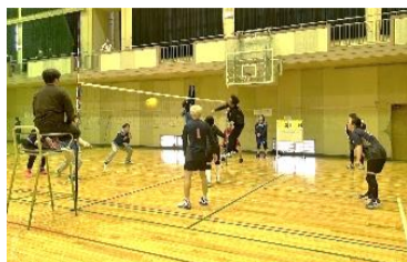
【市の間】接戦でした!