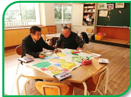
「今日は何の日？」作成中♪ 発表会にも展示します☆

3学期の熟年者マナビ塾は、1月16日（火）からスタートしました。熟年者マナビ塾発表会に向けて、紙皿で作る円型の編み物や折り紙を何枚も重ねた万華鏡を作成しています。発表会までに色鮮やかな作品をたくさん作りたいと思います。