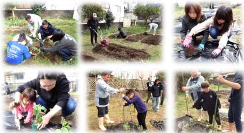
植えた：きゅうり・ナス・ピーマン・トマト・ほうれん草 野菜 インゲン・里芋・まくわ瓜・トウモロコシ