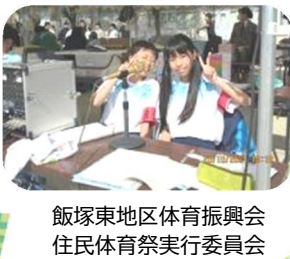
飯塚東地区体育振興会 住民体育祭実行委員会