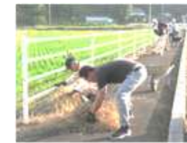
道にゴミを捨てないで!