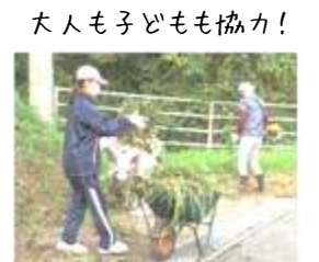
大人も子どもも協力!