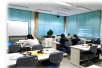
パソコン講座(5・6年生)