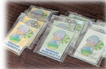
「ふきぼうや」のキーホルダー なんと中学生の手作り！