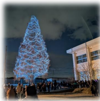
迫力満点の ライトアップツリー