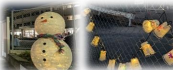
手作りの雪だるまとランタン もライトアップ！