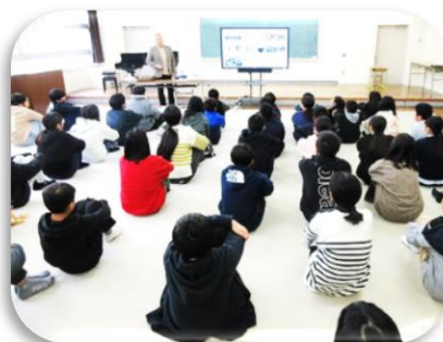
飯塚小学校の様子

『あかね染プロジェクト』も5年目を迎える「あかね染」という言葉も慣れ親しまれてきたのではないのでしょうか。 6年生を対象に、2月12日に飯塚小学校、2月13日に片島小学校であかね染の歴史について勉強し、その後 ハンカチを染める体験授業を行いました。