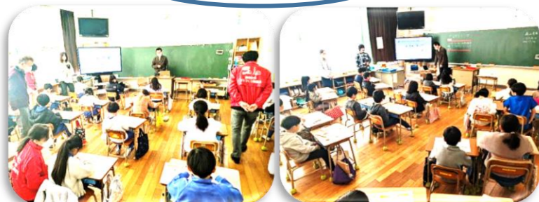
飯塚小学校の様子