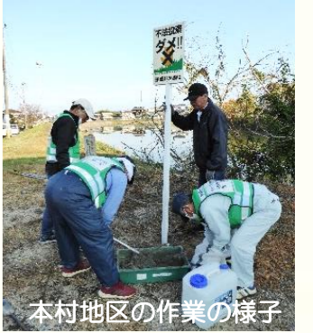
本村地区の作業の様子

11月20日（日）、自治会からの要望により、本村、赤松、すだれ石、鳥羽の4地区に、不法投棄防止の立看板を7本設置しました。 庄内まち協では、「きれいで住みよいまち」になるよう看板設置を行っていますが、今回の作業時にもゴミが散乱していた場所もあり、未だに不法投棄が後を絶ちません。 地域環境美化活動時にも、みなさんゴミの回収にご苦労されています。ゴミ処理のルールを守り、「きれいで住みよいまち」にして行きましょう。