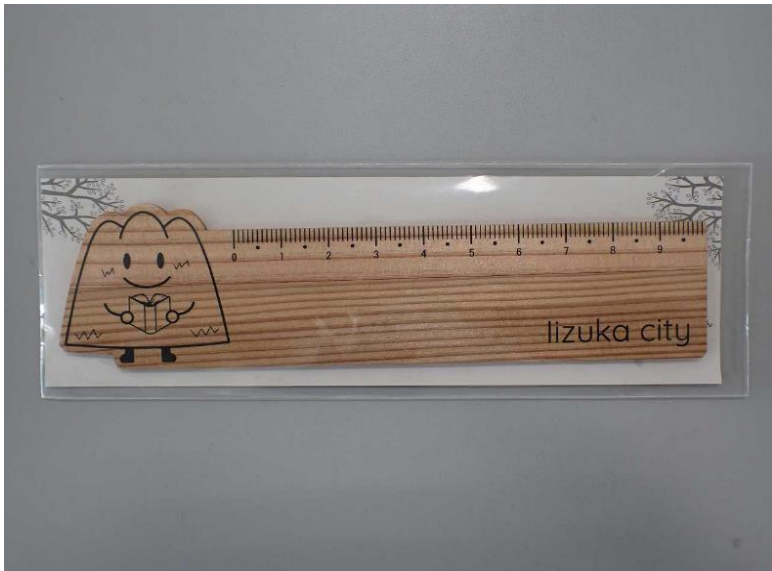
写真③ 作成した定規