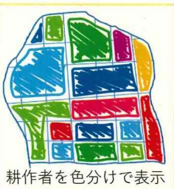
耕作者を色分けで表示