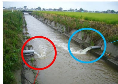
田んぼダム未実施