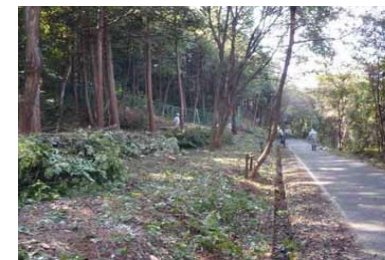
鳥獣緩衝帯（イメージ）

※1 鳥獣被害防止特措法に基づき、市町村が策定する鳥獣被害防止計画に基づく活動の中で設置されたもの等