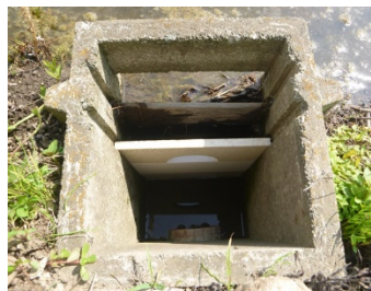
流出を抑制する落水量調整装置の例

「田んぼダム」とは、大雨時に河川や水路の水位の急上昇を抑えることで下流域の湛水被害リスクを低減させることを目的に、水田の落水口に流出量を抑制するための排水調整板を設置する等して雨水貯留能力を人為的に高める取組。