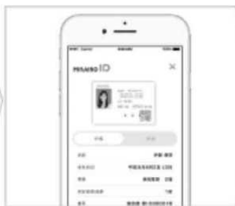
ステップ2 手帳情報を提示