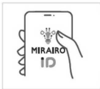
ステップ1 アプリを起動