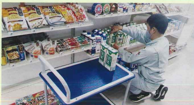
商品陳列作業風景