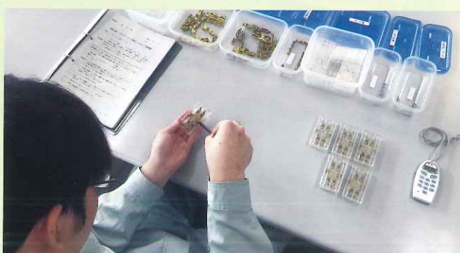
製造基礎実習風景（電気部品組立）