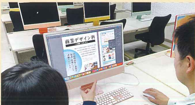
商業デザイン実習風景

技能士補、色彩検定、Illustrator検定、Photoshop検定、 グラフィックデザイン検定