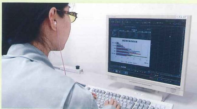
音声パソコン操作実習風景