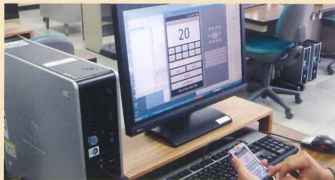
開発した携帯用アプリ実機転送風景

技能士補、基本情報技術者（科目A試験免除講座修了試験も含む） 各種プログラミング検定