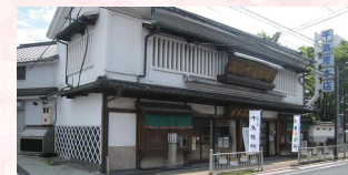
(店舗改修前の千鳥屋本家 本店)

寛永七年創業の千鳥屋本家は長い歴史の中、ここ飯塚の地で炭鉱夫を始めとした人々のため、おいしいお菓子を作り続けてきましたが、やむなく道路拡幅工事に当たり、現在仮店舗にて営業いたしております。新しいお菓子「ヨーデルン」が誕生しました。白壁造りの美しい千鳥屋本家に生まれ変わり、リニューアルオープンした折には2階のミュージアムに楽しい品々を展示いたします。皆様のお越しをお待ちしております。