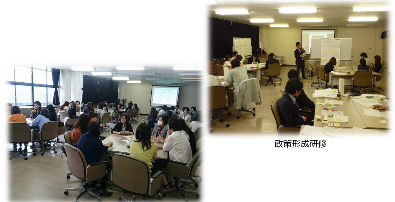
女性職員活躍サポート研修

人事評価制度を活用し、適切に運用することで、職員の人材育成や能力開発に努めます。