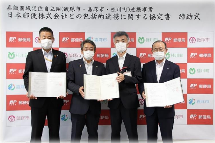
日本郵便株式会社との包括連携協定書締結式