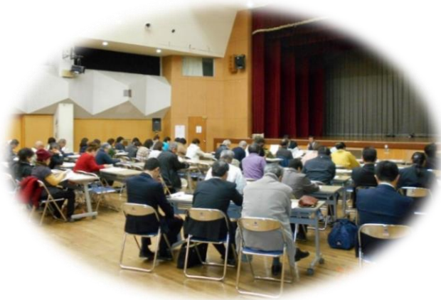
公共施設等のあり方に関する市民懇談会