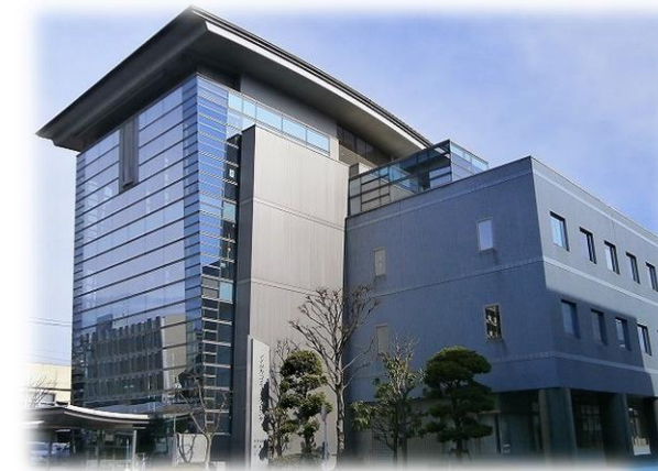
イツカコミュニティセンター

未利用財産について、利活用方針の明確化や売却等に必要な条件整備を図り、売却、貸付けなどを積極的に進めます。