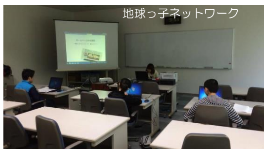
地球っ子ネットワーク