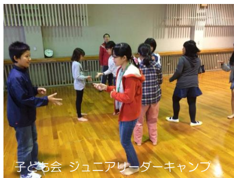
子ども会 ジュニアリーダーキャンプ